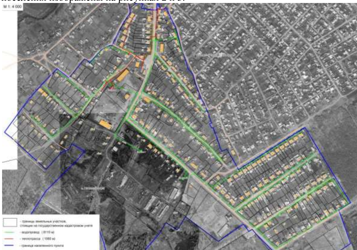
Рис. 2 Существующая зона действия котельной п. Новоисkitимск

Границы существующей зоны действия котельных Ягуновского сельского поселения изображены на рисунках 2 и 3.