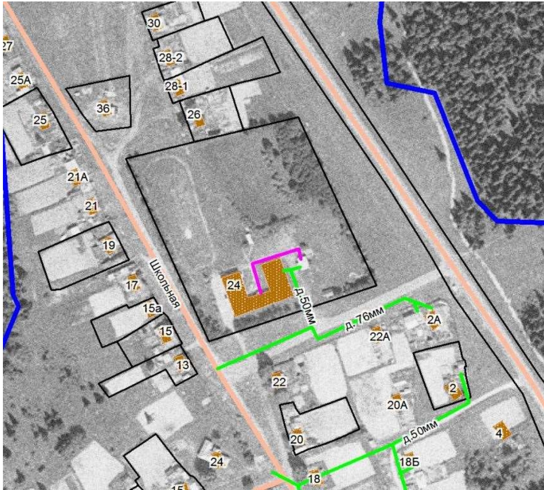
Рисунок 3 – Существующая зона действия котельной № 2 п. Разведчик